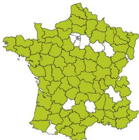
Un réseau de 27 associations membres, couvrant 78 départements