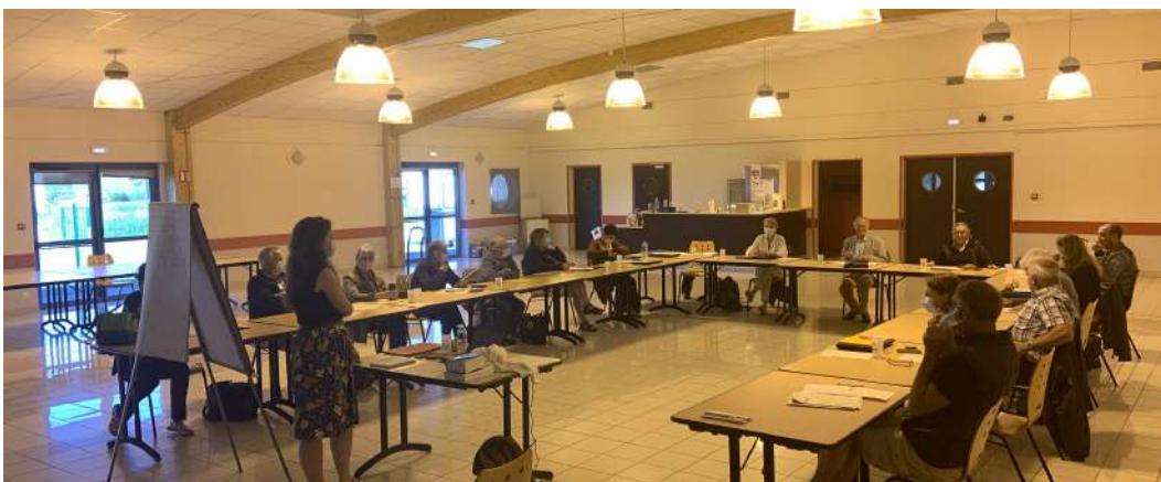
Equipe normande réunie pour la formation baux ruraux