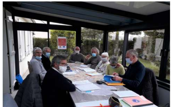
Réunion d'équipe dans l'Orne