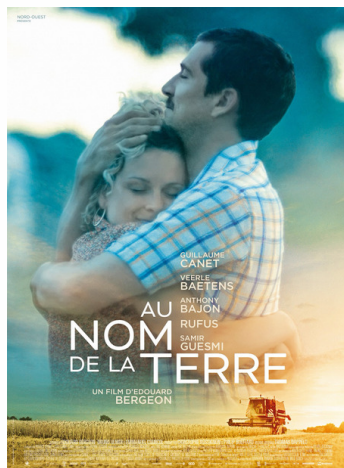
Au nom de la Terre, d'Edouard Bergeon, en salle depuis le 25/09