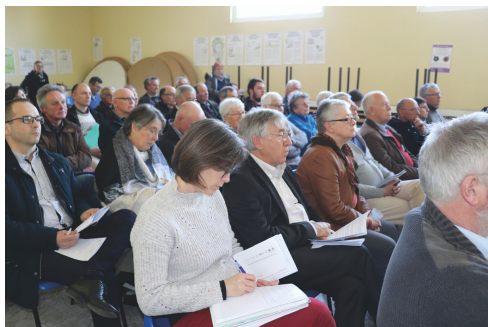
Assemblée Générale 2019